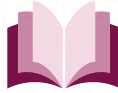
نادي الكتاب الثقافي